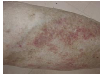
Lesiones purpúricas por toxicodermia

El tratamiento es sintomático, en ocasiones se emplean esteroides por vía sistémica.