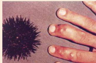
Erizo de mar y lesiones granulomatosas por contacto.

Vibrio vulnificus. Gram negativo. La infección se puede adquirir por vía gastrointestinal, respiratoria (broncoaspiración), o percutánea. Infección por pseudomonas, micobacterium, erisipeloides (Gram positivo).