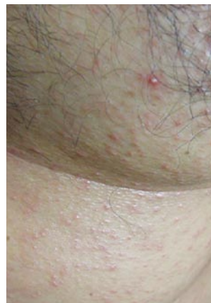
Miliaria en adulto

El tratamiento se hace calmante del prurito, se recomiendan medidas higiénicas, con ropa suave, de algodón, ambiente fresco. Evitar ejercicios bruscos, evitar exposición prolongada al sol, no utilizar jabones irritantes. Para el prurito: lociones antipruriginosas, muy rara vez esteroides tópicos, antihistamínicos VO, se puede indicar anticolinérgicos VO.