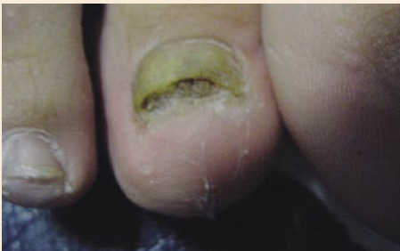
Tiña de las uñas

Localmente se puede aplicar urea 40% más ácido salicílico 30% y cubrir con adhesivo durante 6 días. Esto permite ablandar la lámina. Posteriormente se retira la zona dañada, siempre con precaución en diabéticos y personas con arteriopatías. Localmente se emplean lacas a base de amorolfina y ciclopiroxolamina. Bifonazol. Tratamiento sistémico dependiendo de la etiología. Terbinafina 250 mg VO por tres meses. Itraconazol 400 mg/día por una semana, durante 4-6 meses. Fluconazol 150 mg semanal por 6-8 meses.