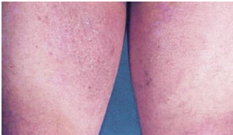
Tiña en región crural

Por vía sistémica: Itraconazol, Terbinafina, Fluconazol, durante dos semanas. Puede quedar residual una zona pigmentada y es conveniente indicación de medidas higiénicas, y control a los tres meses.